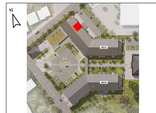
T2 - N° A3.15